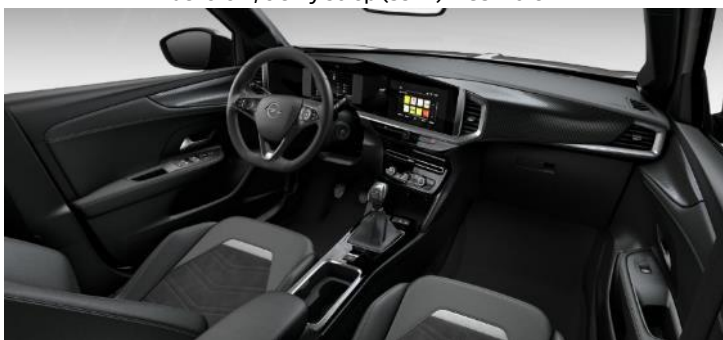
Čalúnenie Ultimate Alcantara, čierne Jet Black, strieborný dekor, čierny strop (SHFT) GS – 700 € / Ultimate – štandard