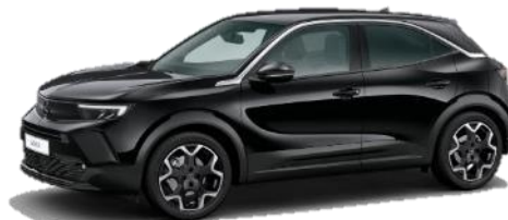
Čierna Karbon (9VM0) 550 €