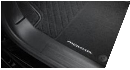
Súprava tvarovaných kobercov vpredú&vzadu Koberce Economy z extrémne odolného materiálu. Jemný čierny okraj a Mokka logo vpredú Číslo dielu: 1671152780 Cenniková cena: 64,8 €