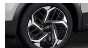
18" dvojfarebné disky z ľahkých zliatin (ZHN6)