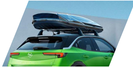
Strešný box Thule "Ocean 80,, Elegantný strešný box praktického formátu. Rozmery: 133 x 86 x 37 cm. Objem: 320 l Číslo dielu: 1662444280 Cenniková cena: 289,37 €