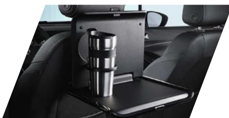
FlexConnect sklápny stolček potrebné objednať FlexConnect adaptér Číslo dielu: 9834352180 Cenniková cena: 177,41 €