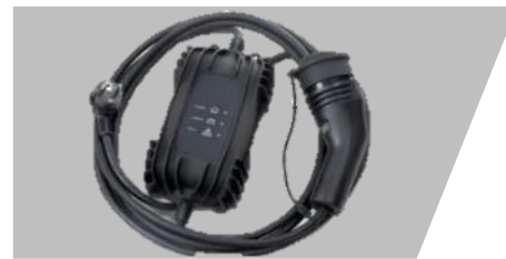
Kábel režimu 2 - typ EF, 1 fáza - 8 A - 6 m, pripojenie do domácej zásuvky Číslo dielu: 9850525180 Cenniková cena: 420 €