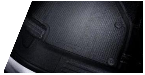
Súprava gumových tvarovaných kobercov -4ks Ochránia podlahu pred vlhkosťou, snehom a nečistotami. Nápis Mokka vpredú Číslo dielu: 1671152380 Cenniková cena: 67,36 €