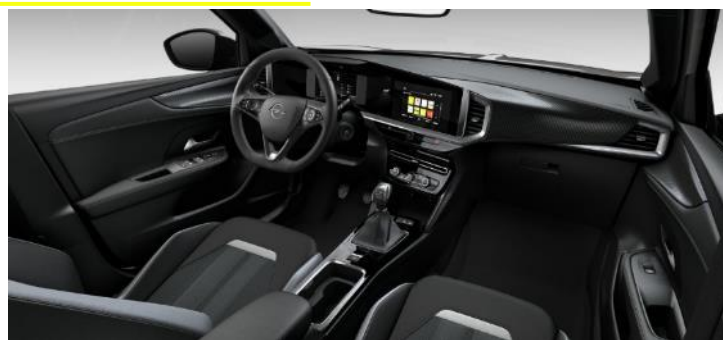
Čalúnenie kombinácia vinyl/látka GS, čierne Jet Black so strieborným dekorom, čierny strop (S9FT) – GS – 0 €