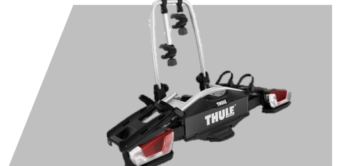
Nosič pre 2 bicykle na ťažné zariadenie Jednoduchá montáž bicyklov vďaka odnímateľným fixačným ramenám, nosnosť 46kg Číslo dielu: 1629425880 Cenniková cena: 715,58 €