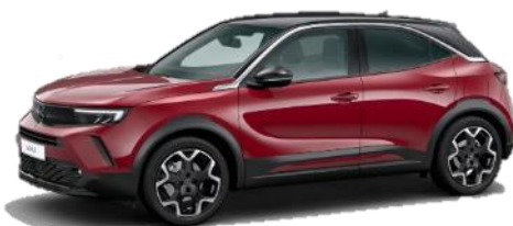
Červená Kardio (PYM0) 550 €