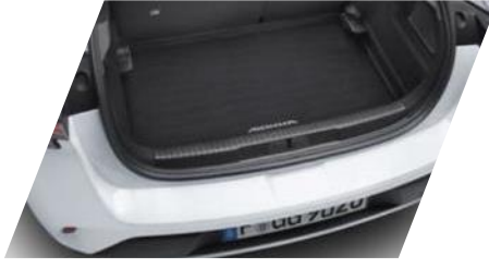
Vanička do batožinového priestoru, obojstranná Vanička s protišmykovou úpravou. Vrchná časť z čierneho koberca, spodná časť z čistiteľnej gúmy. Vysoký, stabilný okraj (30 mm) s nápisom Mokka. Číslo dielu: 9837878380 Cenniková cena: 106,81 €