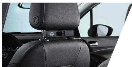
FlexConnect adaptér Číslo dielu: 9834351380 Pôvodná cena: 59 €