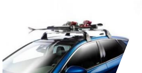
Nosič lyží/snowboardov Thule 7324, 4 páry lyží Číslo dielu: 9858802280 Cenniková cena: 323,62 € * v ponuke aj pre 6 párov