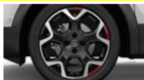
18" dvojfarebné disky z ľahkých zliatin s 5 lúčmi (ZHQ1) / s červenými prvkami (ZHA3)