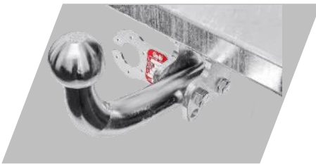
Ťažné zariadenie Galia Skrutkové prevedenie: 208€ Bajonetové prevedenie: 270,41 €