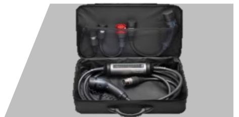
Kábel režimu 2 - Univerzálny, Súprava s nabíjacou jednotkou IC-CPD, max. 22 kW, konektor, typu 2 pre vozidlo a 3 adaptéry pre pripojenie k elektrickej sieti (Typ2+CEE16/ 3p+CEE7/7) Číslo dielu: 9846031480 Cenniková cena: 1 300 €