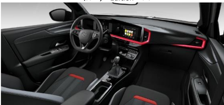
Sada Red - Čalúnenie kombinácia vinyl/látka GS, čierne Jet Black s červeným dekorom, čierny strop (S9FJ) – GS – 350 €