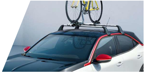
Strešný nosič bicykla Thule "Expert 298" Číslo dielu: 9858801180 Cenniková cena: 327,74 €