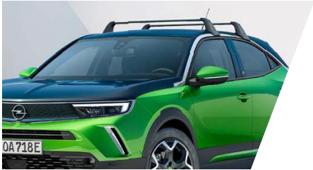
Priečne strešné hliníkové nosiče Sada 2 ks. aerodynamický hliníkový nosič, ľahká inštalácia, uzamykateľné uzávery, nosnosť strechy 75 kg. Číslo dielu: 9841125680 Cenniková cena: 343,02 €