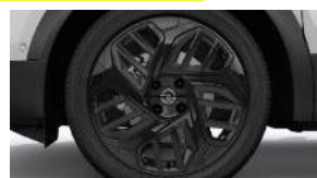
18" dvojfarebné disky z ľahkých zliatin (ZHM6)