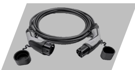
Kábel režimu 3, 6 m pripojenie do nabíjacej stanice (domácej alebo verejnej) 1 fáza-7,4 kW-32A-č.dielu: 9844681180 - 421 € 3 fázy-11 kW-3x16A-č.dielu: 9844681380 - 503 € 3 fázy-22 kW-3x32A-č.dielu: 9844681480 - 478 €