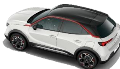
Sada Red-červené lišty okolo bočných okien, 18" dvojfarebné disky z ľahkých zliatin Diamond Cut s 5 lúčmi a červenými prvkami (S9FJ) GS 350 €