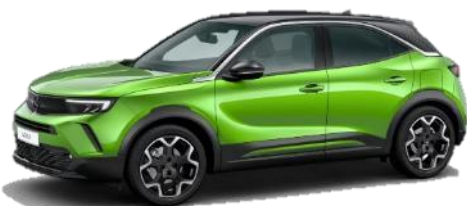
Zelená Ikone (HUM0) 550 €