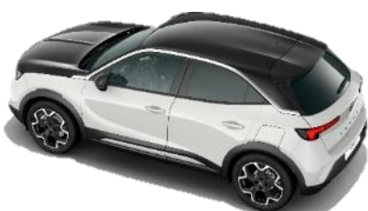
Čierna strecha Diamond Black (JD20) – 500 € / GS&Ultimate štandard Čierna kapota Karbon Black (7N02) – GS/Ultimate 250 €