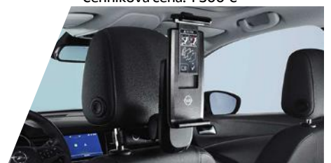
FlexConnect držiak tabletu (univerzálny) potrebné objednať FlexConnect adaptér Číslo dielu: 9834352980 Cenniková cena: 231,23 €