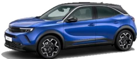
Modrá Voltaik (AVM0) 550 €