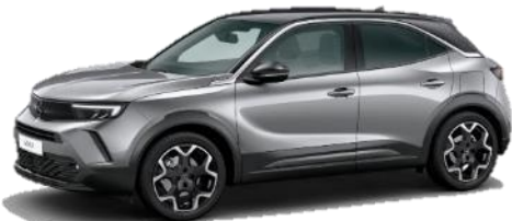
Šedá Kontrast (F4M0) 550 €