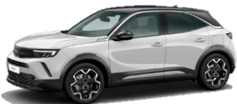
Biela Arktis (WPP0) 0 €