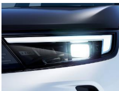
Intelli-Lux LED® pixelové svetlo

Opel Pure Panel® s najnovšími technológiami, plne digitálny 12-palcový informačný displej